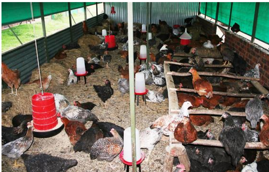
ภาพที่ 2.10 คอนนอน