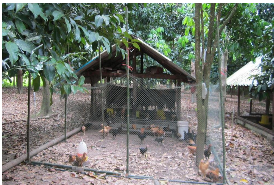
ภาพที่ 2.4 การเลี้ยงไก่แยกออกจากบ้านอาศัย