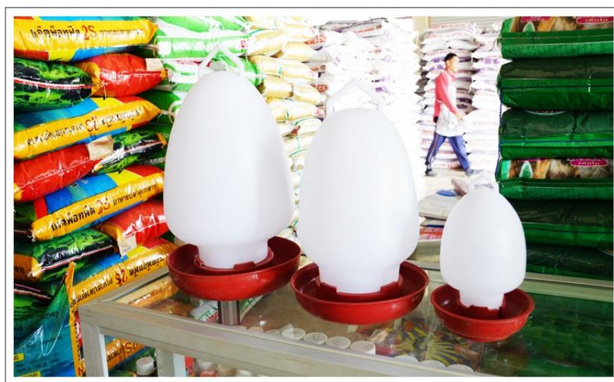
ภาพที่ 2.8 กระดิกน้ำไก่ ที่มา: ซีรีส์อาหารสัตว์ (2559)