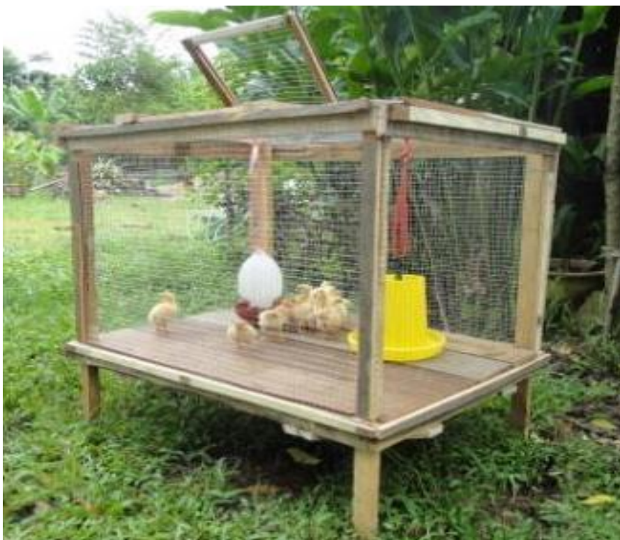
ภาพที่ 2.12 กรงไก่