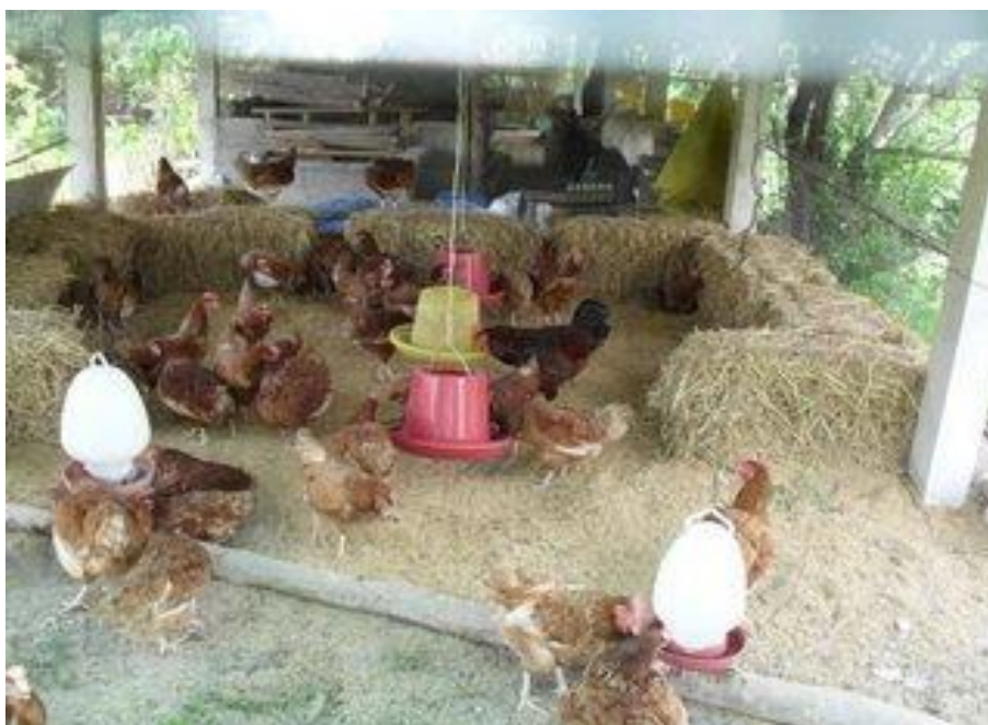
ภาพที่ 2.3 การเลี้ยงไก่ได้ยุ่งฉางหรือใต้ถุนบ้าน