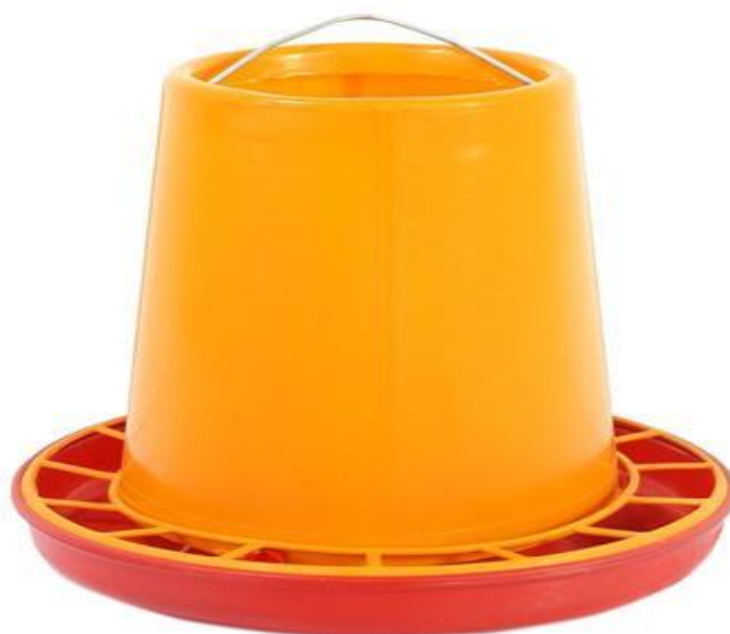
ภาพที่ 2.6 ถังอาหารไก่