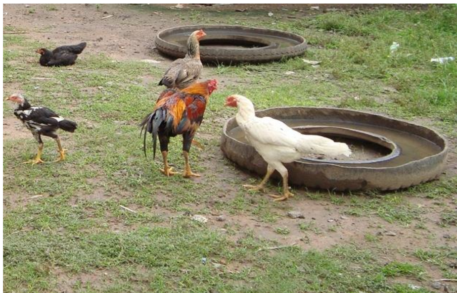
ภาพที่ 2.7 รางน้ำทำด้วยล้อยางรถยนต์

2. ภาชนะใส่น้ำ ควรจัดหามาให้ไก่พื้นเมืองได้กินน้ำตลอดเวลาภาชนะใส่น้ำนี้อาจใช้ไม้ไผ่ผ่าซีก ถ้วย จาน อ่างดิน (ภาพที่ 2.7) หรือจะซื้อกระดิกน้ำไก่แบบสำเร็จรูปจากร้านจำหน่ายสินค้าเกษตรที่มีจำหน่ายอยู่ทั่วไปก็ได้ (อรวรรณ, 2574) (ภาพที่ 2.8)