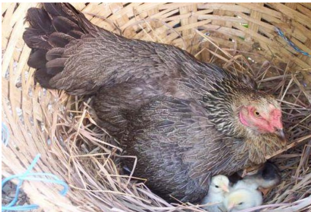
ภาพที่ 2.9 รังไข่

3. รังไข่ รังไข่เป็นสิ่งจำเป็นและต้องมีให้ครบตามจำนวนแม่ไก่พื้นเมืองหรือมีให้มากกว่าจำนวนไก่ได้ก็ยิ่งดี มิฉะนั้นจะเกิดปัญหาแม่ไก่พื้นเมืองแย่งรังไข่กัน ขนาดของรังไข่ควรกว้าง 1 ฟุต ยาว 1 ฟุต สูง 8 นิ้ว แล้วใช้ฟางหญ้าแห้งรองเพื่อป้องกันไข่แตก รังไข่ที่ใช้กันอยู่ทั่ว ๆ ไป อาจจะใช้ขี้เถ้า ปุ๋ยคอก หรือ ตะกร้าเก่า ๆ (ภาพที่ 2.9) ไปวางไว้ให้ไก่พื้นเมืองไข่ก็ได้ ที่สำคัญที่ตั้งของรังไข่ควรอยู่ในตำแหน่งที่สูง ไม่ควรวางรังไข่บนพื้นดินเหมือนไก่ไข่ และควรอยู่ในมุมหรือตำแหน่งที่มีคซิด ไม่ถูกแดดและฝน มิฉะนั้นไข่ไก่จะเน่าเสีย ฟักไม่ออกเป็นตัวก็ได้ เมื่อมีการฟักไข่ไปครอกหนึ่ง ควรเปลี่ยนวัสดุรองไข่เสียทีหนึ่ง