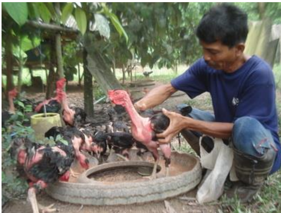
ภาพที่ 2.5 รังอาหารทำด้วยล้อยางรถยนต์