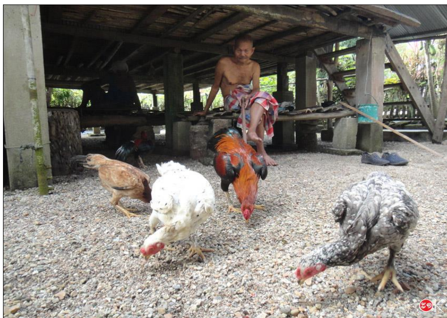
ภาพที่ 2.2 การเลี้ยงไถ่บริเวณบ้าน ที่มา: โอเคนชั้นต้อทเน็ต (2558)