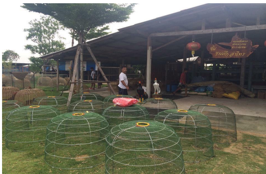
ภาพที่ 2.11 สุ่มไก่

5. สุ่มหรือกรง ในกรณีที่ต้องการอนุบาลลูกไก่พื้นเมืองในระยะแรก เพื่อให้ลูกไก่พื้นเมืองมีความแข็งแรงพอที่จะวิ่งหรือเดินตามแม่ไก่พื้นเมืองนั้น ควรเตรียมสุ่มไว้ 1-2 ใบ (ภาพที่ 2.11) เพื่อใช้ขังแม่ไก่พื้นเมืองและลูกไก่พื้นเมืองใน 1-2 สัปดาห์แรก หากจะใช้กรงควรทำเป็นกรงขนาดเล็กโดยยกให้สูงจากพื้นประมาณ 20-30 เซนติเมตร (ภาพที่ 2.12)