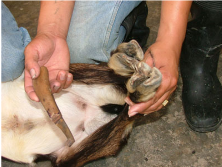
ภาพที่ 4.119 แสดงมิดแต่งกีบ

นอกจากนี้ควรมีเครื่องมือถอนแพะตัวผู้ (Burdizzo) เหล็กจี้เขา เครื่องจี้เขาไฟฟ้า คีมแต่งกีบ เหล็กตีเบอร์หรือคีมหนีบเบอร์หู (Tattooing machine) เครื่องกกกลูกแพะ ขวดป้อนนม ถังให้น้ำนมลูกแพะชนิดรวม อุปกรณ์ผสมเทียม เครื่องมือแพทย์ เช่น เครื่องมือถ่ายพยาธิ กระบอกกรอกยาถ่ายพยาธิ ชุดทำแผล เข็มฉีดยา เครื่องฟันเห็บ กรรไกรหรือปัตตาเลี่ยนไฟฟ้าสำหรับตัดขนแกะ ฯลฯ ภาพที่ 4.119-4.128