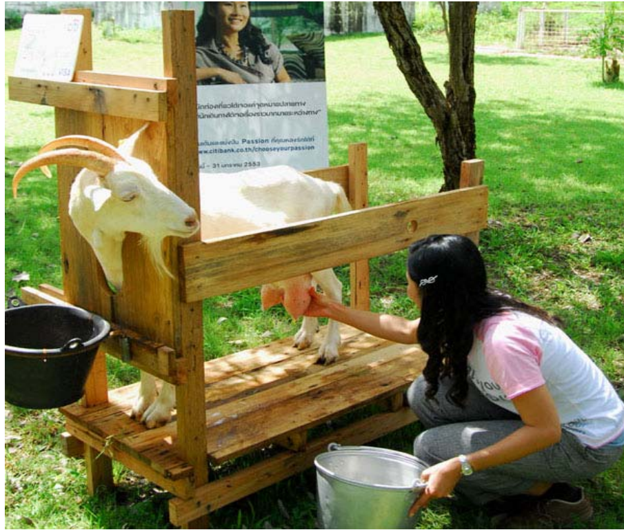
ภาพที่ 4.117 แสดงของรีดนม