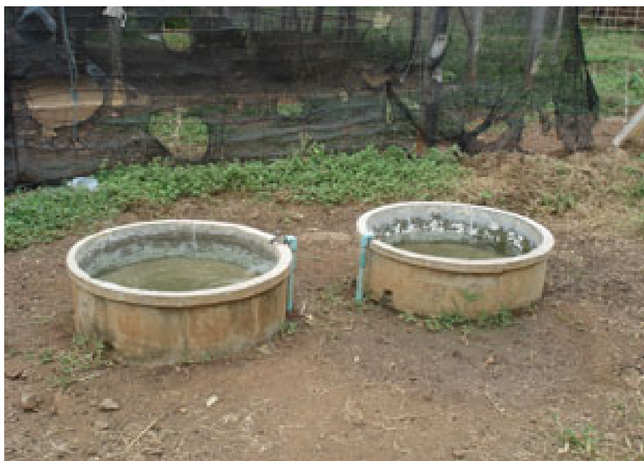
ภาพที่ 4.112 แสดงอ่างน้ำรวม