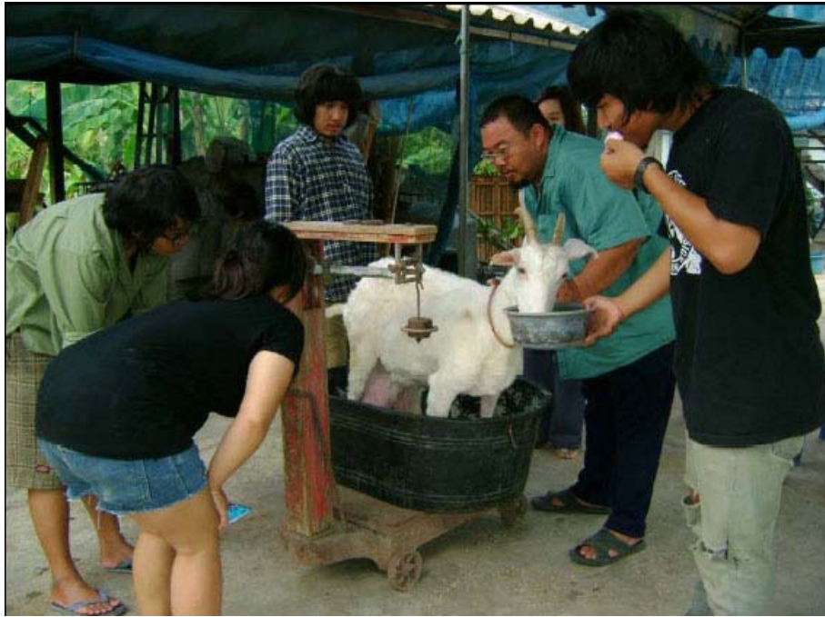
ภาพที่ 4.126 แสดงตาชั่งแขวนขนาด 500 กก.