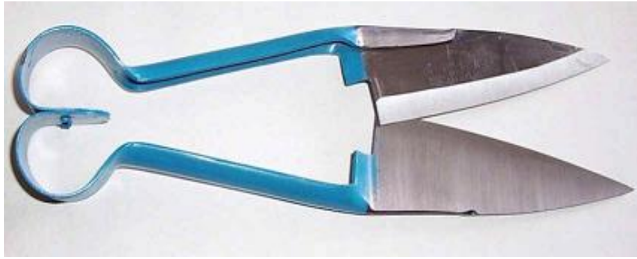
ภาพที่ 4.128 แสดงกรรไกรสำหรับตัดขนแกะ