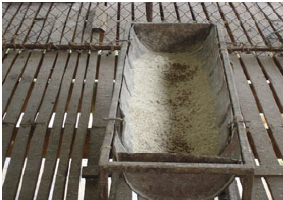
ภาพที่ 4.109 แสดงรางอาหารรวมแบบเคลื่อนที่