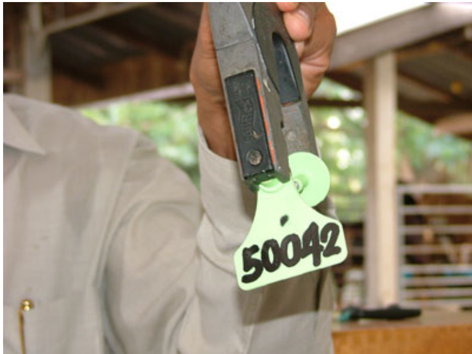
ภาพที่ 4.121 แสดงคีมติดเบอร์หู