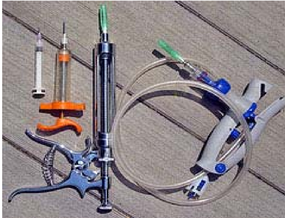
ภาพที่ 4.124 แสดงไซริงก์ฉีดวัคซีน