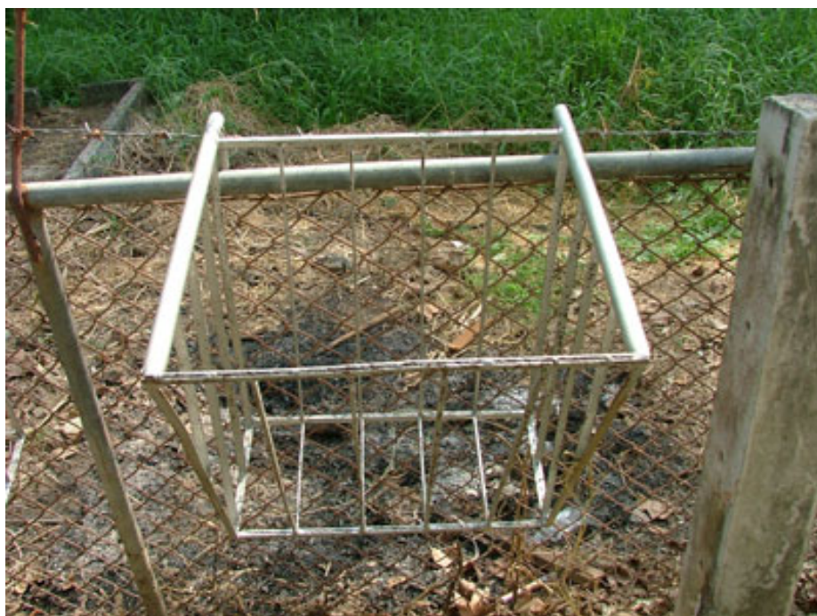
ภาพที่ 4.115 แสดงรางหญ้าเดี่ยวหรือรวมแบบแวน