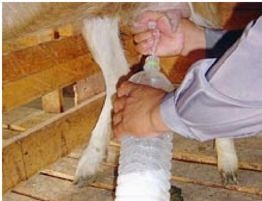
ภาพที่ 4.118 แสดงเทคนิคการรีดนมแพะใส่ขวดปากแคบ