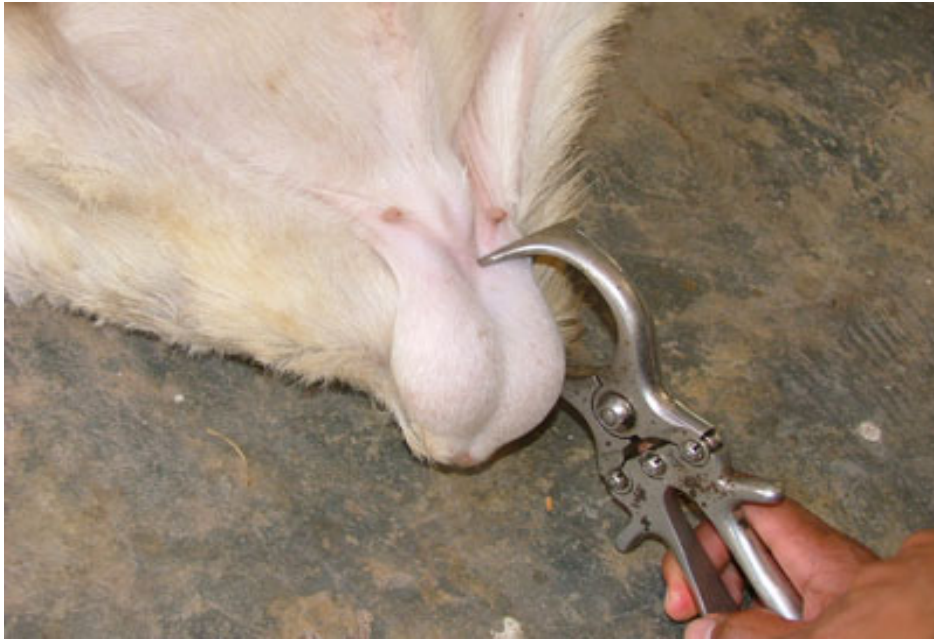
ภาพที่ 4.120 แสดงคีมตอน