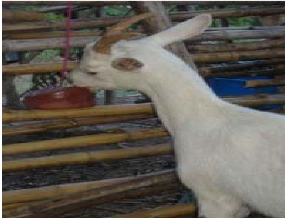
ภาพที่ 4.110 แสดงการให้แร่ธาตุก้อนแบบแขวน