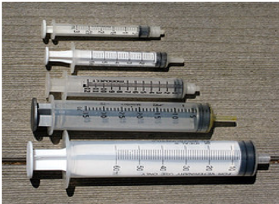
ภาพที่ 4.123 แสดงไซริงก์ขนาดต่าง ๆ