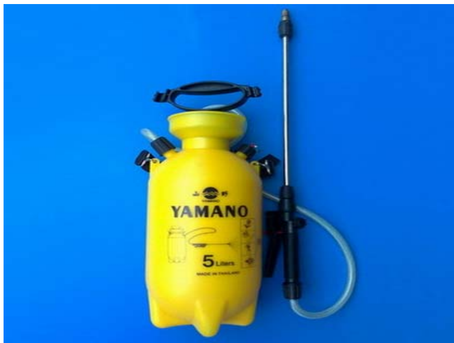
ภาพที่ 4.125 ถังพ่นยาฆ่าพยาธิภายนอก