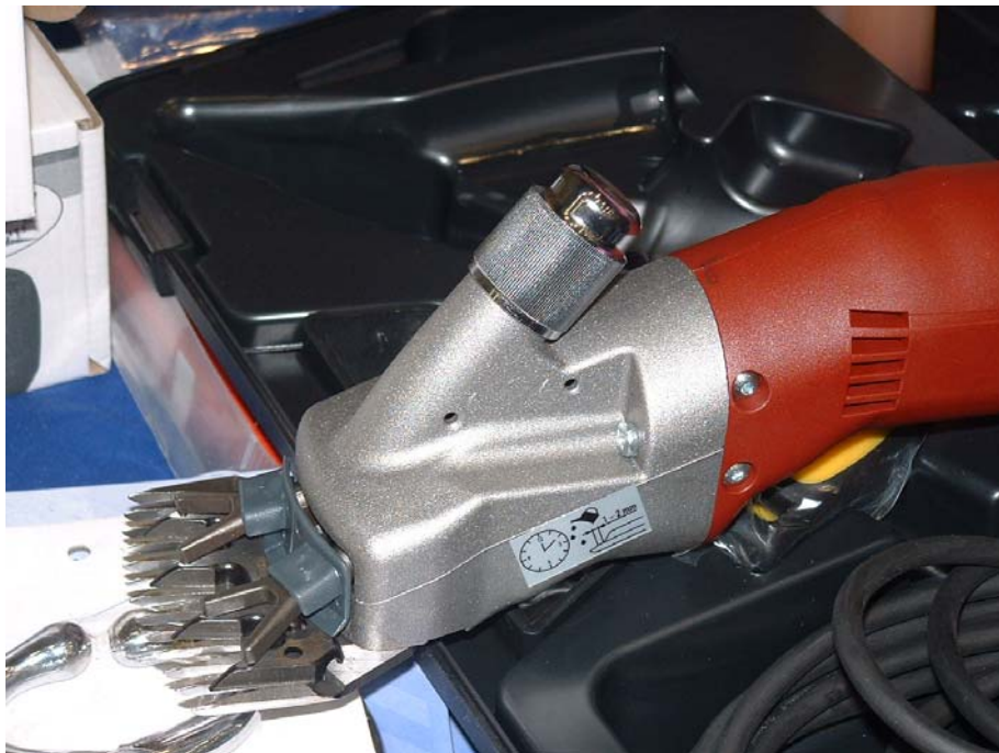
ภาพที่ 4.127 แสดงปัตตาเลี่ยนไฟฟ้าสำหรับตัดขนแกะ