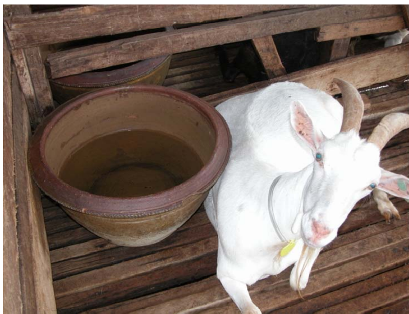
ภาพที่ 4.113 แสดงอ่างน้ำแบบแยก