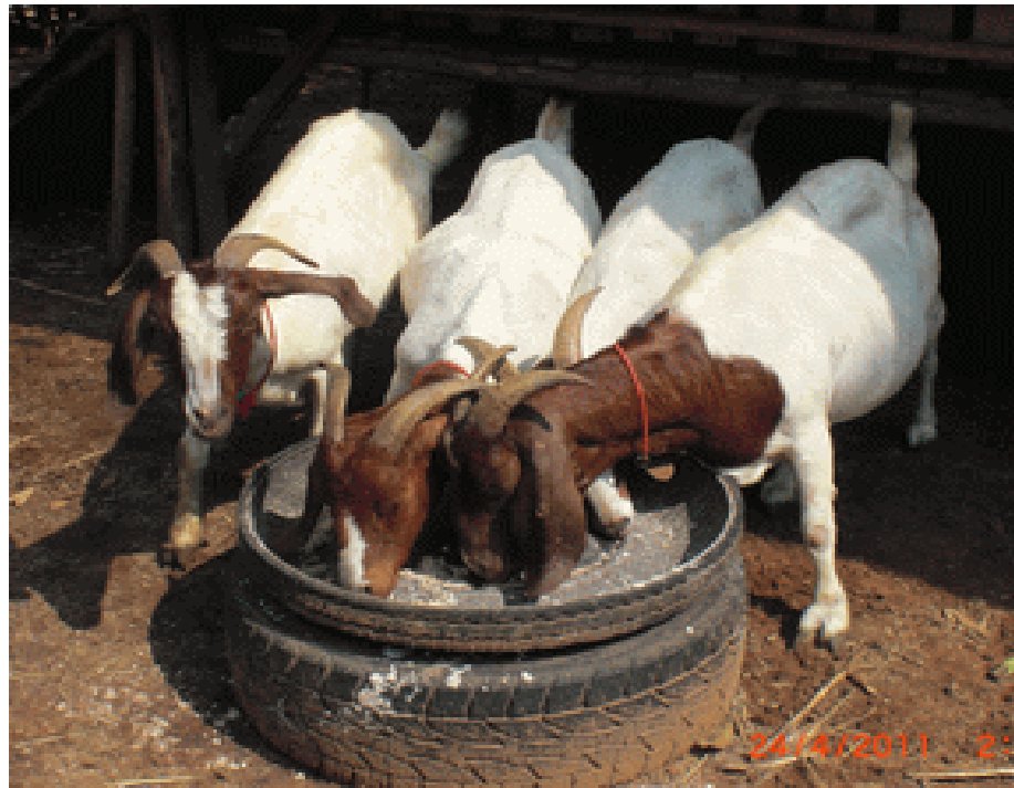
ภาพที่ 4.111 แสดงการให้อาหารหรือเกลือเสริมโดยใช้อ่าง