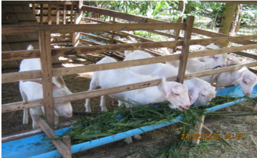
ภาพที่ 4.108 แสดงรางอาหารแบบติดตั้งกับคอก

อุปกรณ์ในการเลี้ยงแพะและแกะที่สำคัญ ได้แก่ ถังรองน้ำ รางอาหาร และที่ใส่แร่ธาตุหรือเกลือ อุปกรณ์เหล่านี้มีทั้งชนิดที่ประกอบไว้กับคอกในคอกเดี่ยว วางไว้ตรงกลางคอกสำหรับคอกรวม และวางไว้บริเวณลานรอบ ๆ คอกอีกชุดหนึ่งภายใต้หลังคากันแดด กันฝน ภาพที่ 4.108-4.115