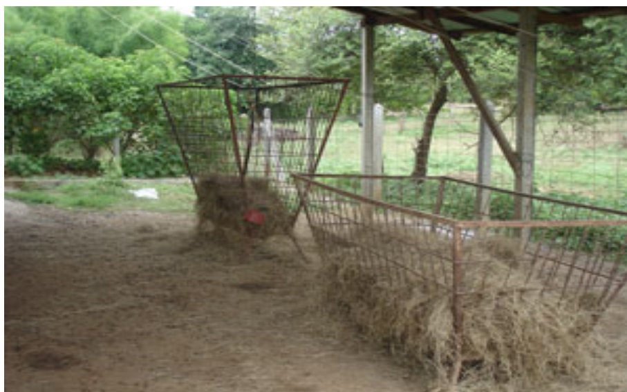
ภาพที่ 4.114 แสดงรางหญ้ารวมแบบต่าง ๆ