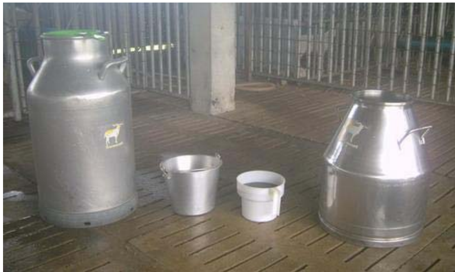
ภาพที่ 4.116 แสดงอุปกรณ์รีดนม ประกอบด้วย ถังรวมนมใบใหญ่ ถังรีดนม ถ้วยตรวจสอบน้ำนม และถังนมรวมใบขนาดกลาง

ภาชนะที่ใช้รองรับน้ำนมควรเป็นกระป๋องหรือถาดปากกว้างที่มีความจุ 2-5 ลิตร (หลายฟาร์มที่มีความชำนาญในการเลี้ยงแพะนม จะใช้ขวดพลาสติกปากกว้าง หรือใช้เหยือกปากกว้างรองรับน้ำนม ด้วยสมมุติฐานที่ว่าขนแพะตกลงไปในน้ำนมเพียงเส้นเดียวจะทำให้ น้ำนมมีกลิ่นได้แล้ว ผู้เลี้ยงต้องฝึกและสังเกตเอาเอง) และมีถังใส่น้ำล้างเต้านมและผ้าสำหรับเช็ดเต้านม คอกรีดนมควรวางให้ห่างจากคอกพ่อพันธุ์ให้มากที่สุดเพราะกลิ่นของพ่อแพะแรงมาก อาจแพร่กลิ่นสู่น้ำนมได้ (ภาพที่ 4.116-4.118)