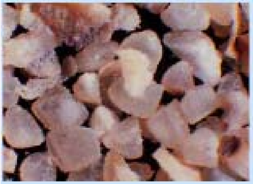
ภาพที่ 5.28 แสดงข้าวฟางป่นหยาบ