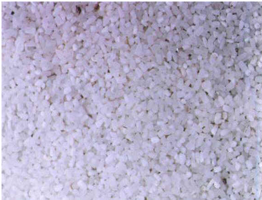
ภาพที่ 5.29 แสดงปลายข้าว