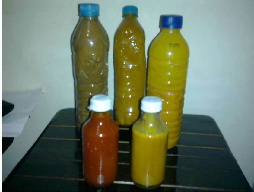
ภาพที่ 5.32 แสดงตะกอนน้ำมันปาล์ม (palm-sludge-oil)