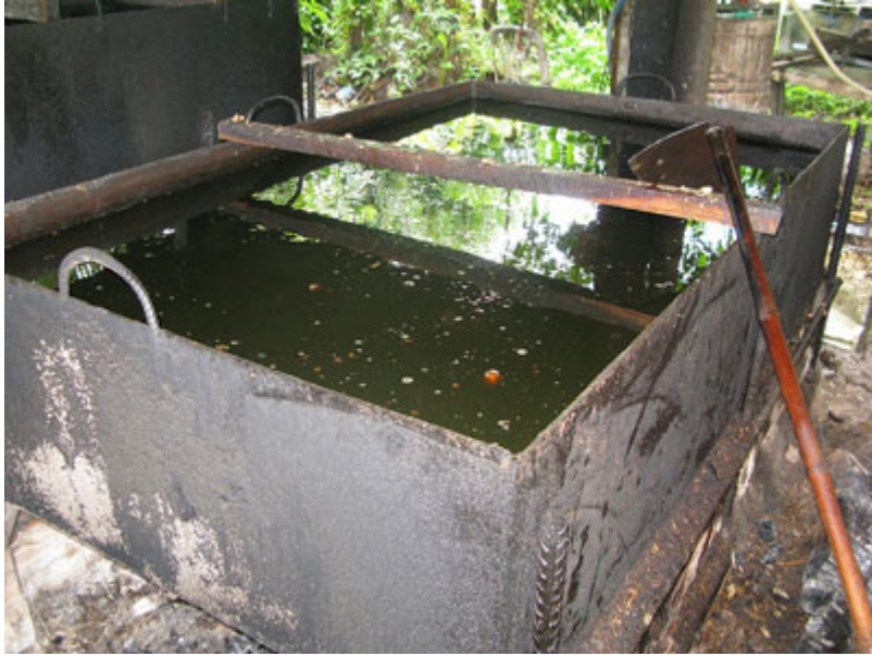
ภาพที่ 5.33 ไขมันวัวเจียว