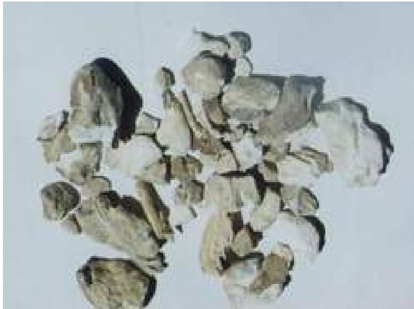
ภาพที่ 5.31 แสดงมันสำปะหลัง (มันเส้น)

ที่มา: สำนักพัฒนาอาหารสัตว์ กรมปศุสัตว์ (2555)