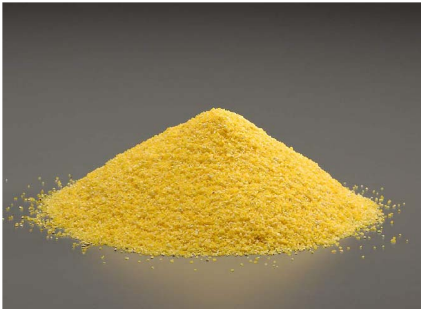
ภาพที่ 5.27 แสดงข้าวโพดป่น

1) ได้จากพืช ได้แก่ ธัญพืช เช่น ข้าวโพด (ภาพที่ 5.27) ข้าวฟ่าง (ภาพที่ 5.28) ปลายข้าว (ภาพที่ 5.29) รำละเอียด (ภาพที่ 5.30) เป็นต้น พืชหัว เช่น มันสำปะหลัง (มันเส้น) (ภาพที่ 5.31) เป็นต้น และน้ำมันพืชต่าง ๆ (ภาพที่ 5.32)