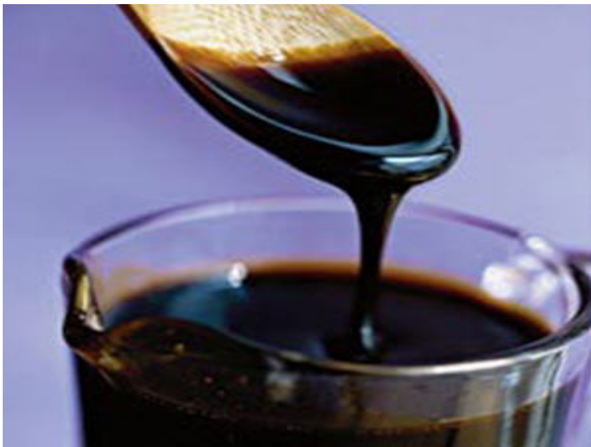
ภาพที่ 5.34 แสดงกากน้ำตาล