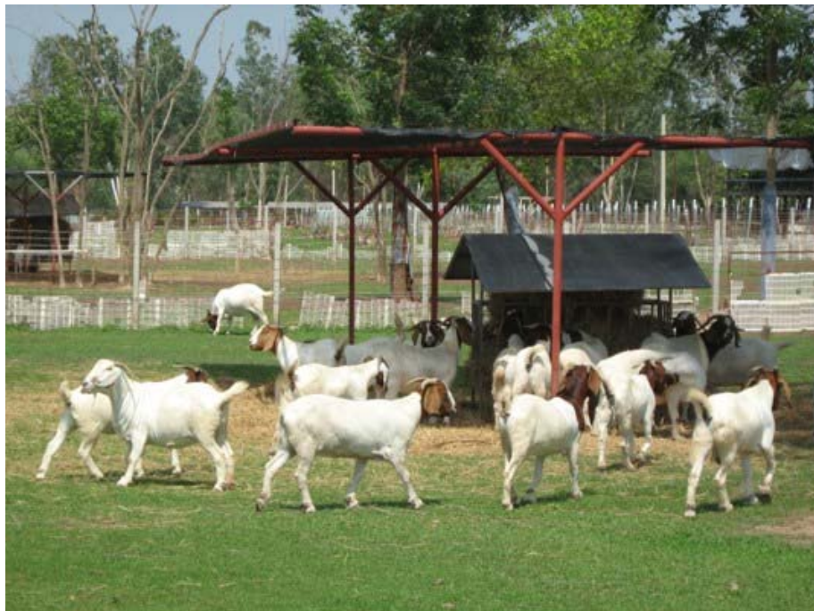
ภาพที่ 6.19 แสดงวิธีการเลี้ยงแพะ-แกะขุนในแปลง