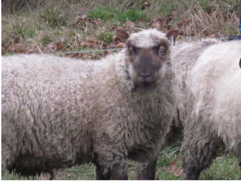
ภาพที่ 6.21 แสดงฟอแกะอายุ 10 เดือน