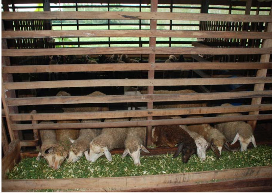
ภาพที่ 6.18 แสดงวิธีการเลี้ยงแพะ-แกะขุนในคอก