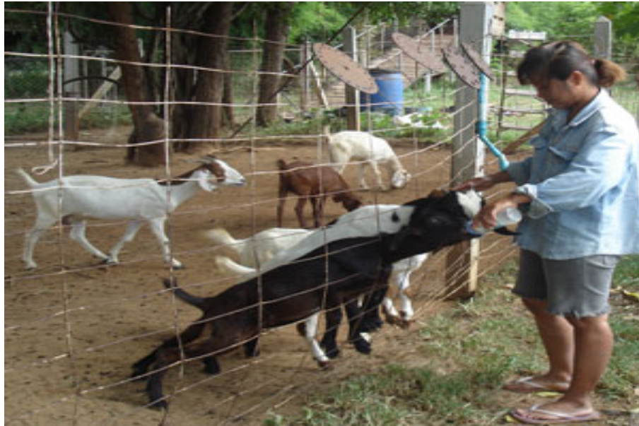
ภาพที่ 6.17 แสดงวิธีการให้นมลูกแพะแบบป้อนด้วยขวด