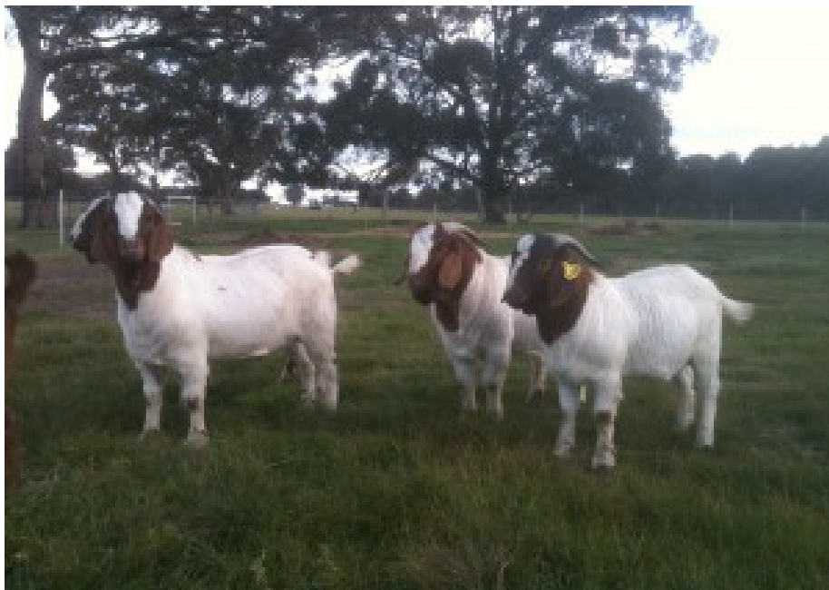
ภาพที่ 6.20 แสดงพ่อแพะอายุ 10 เดือน

ลูกแพะ-แกะที่คัดไว้ทำพันธุ์จะต้องดูแลให้อาหารอย่างดี เมื่ออายุครบ 3 เดือน ต้องแยกลูกตัวผู้ออกไปต่างหากเพื่อป้องกันการผสมก่อนวัยอันควร เมื่อครบ 10 เดือน (ภาพที่ 6.20-6.21) จึงจะใช้แพะ-แกะหนุ่มเพื่อการผสมพันธุ์ โดย แพะ-แกะหนุ่มอายุ น้อยกว่า 1 ปี ต่อแม่พันธุ์ 10–15 ตัว โดยผสมประมาณ 2 ครั้ง/สัปดาห์ ถ้าพ่อพันธุ์อายุ มากกว่า 1 ปี จะใช้ผสมแม่พันธุ์ได้ 20–30 ตัว อาจผสมได้ทุกวัน ขึ้นอยู่กับความสมบูรณ์ของพ่อพันธุ์ (อาจสูงถึง 1:50-100 ตัว แต่ไม่จำเป็นไม่ควรมากขนาดนี้) พ่อแพะ-แกะต้องการพื้นที่กว้าง ๆ สำหรับออกกำลังกายเมื่อไม่ได้คุมฝูง เพื่อไม่ให้อ้วนอ้วนเกินไป