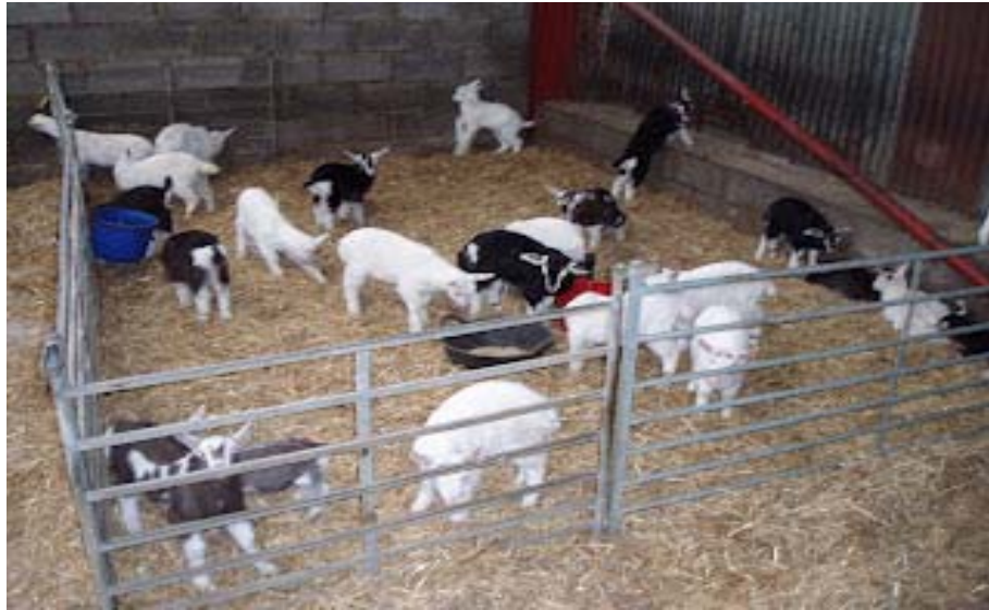
ภาพที่ 6.15 แสดงคอกเลี้ยงลูกแพะอ่อน