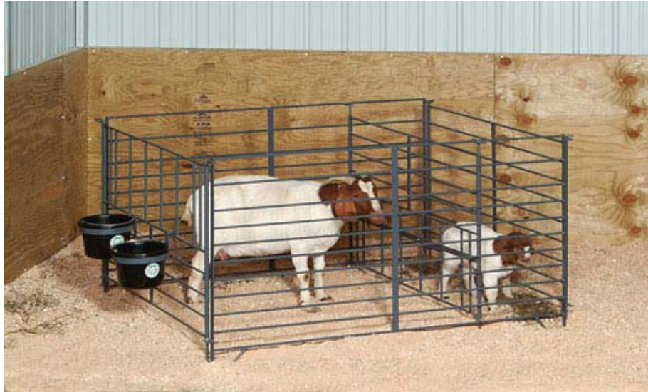
ภาพที่ 6.14 แสดงแบบคอกเลี้ยงแม่และลูก ให้แยกจากกันโดยเด็ดขาดอย่างน้อย 7 วัน

โดยทั่วไปลูกแพะแรกเกิดมีน้ำหนักประมาณ 2.5 กิโลกรัม เพศผู้จะหนักกว่าเพศเมียเล็กน้อย ร่ายที่มีน้ำหนักแรกเกิดน้อยจะอ่อนแอ ต้องช่วยเหลือดูแลอย่างใกล้ชิด สัปดาห์แรกให้แยกแม่และลูกออกจากกันทั้งกลางวันกลางคืน ถึงเวลากินนมค่อยอยู่ร่วมกัน เพราะแม่แพะอาจนอนทับลูกได้ (ภาพที่ 6.14-6.15) อัตราการเจริญเติบโตของลูกแพะในระยะคนนมประมาณวันละ 200 กรัม